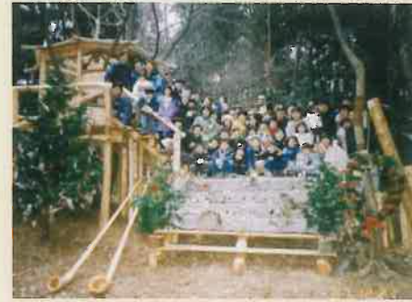
1997年 森のクリスマス会